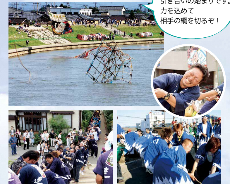
堤防の下まで網を引く行列ができます。