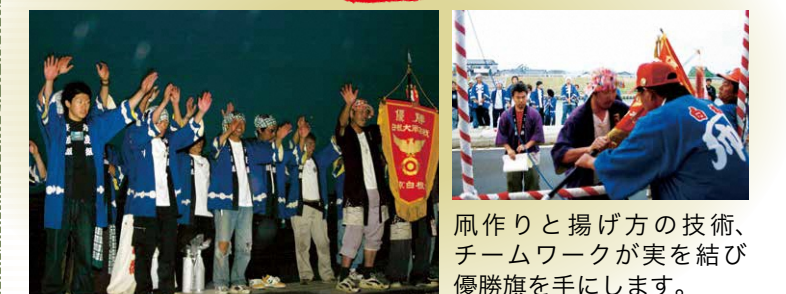
凧作りと揚げ方の技術、チームワークが実を結び優勝旗を手にします。