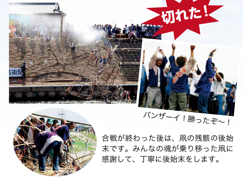
合戦が終わった後は、凧の残骸の後始末です。みんなの魂が乗り移った凧に感謝して、丁寧に後始末をします。

互いの網を引き合っ、相手の網を切ったほうが勝ちとなり、期間中の通算成績で順位を決めます。1年かけて作り上げた汗の結晶です。