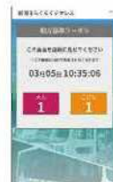
<新潟市観光循環バス>