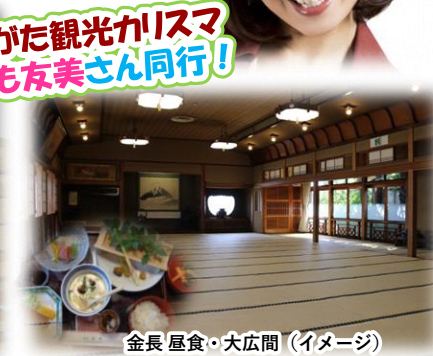
金長 屋食・大広間 (イメージ)

新潟駅南口(9:30) - 満徳寺 (1度回すとすべてのお経を読破する価値があるといわれる「輪蔵」を体験) - JA新潟かがやき (選果・出荷場の見学) - 金長 (歴史ある建物の見学・ご昼食) - 中村観光果樹園 (ショッピング) - 新潟市アグリパーク (農産物直売所でショッピング) - 新潟駅南口(15:30)