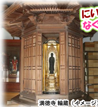
満徳寺 輪蔵 (イメージ)