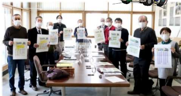
時刻表を作成した第1部会の皆さん

6種類の時刻表が作成されましたが、その内の一つが月潟住民バスの時刻表です。この便りの裏面に掲載していますので、ご活用ください。