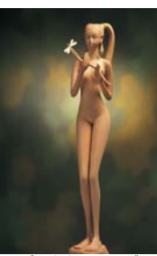
《聖少女シリーズ》より