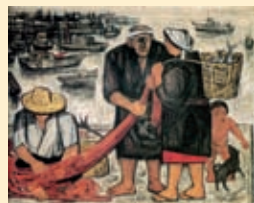
小島丹彦《昼(漁港)》1974年 (新潟市新津美術館蔵)