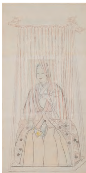
1. 小林古径《丘》 1951年 紙本彩色 小林古径記念美術館 2. 小林古径《楊貴妃大下絵》 1951年 紙本彩色 個人蔵 3. 小島丹彦《昼(漁港)》 1974年 紙本彩色 新潟市新津美術館