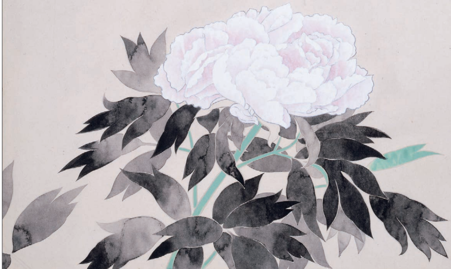
小林古径(牡丹(絶筆))1956年頃 紙本彩色 小林古径記念美術館