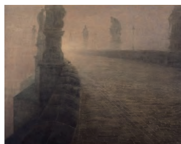
4. 伊藤彰耳《春ふたたび》 2011年 紙本彩色 個人蔵 5. 齋藤満栄《橋(カレル)》 2008年 紙本彩色 新潟県立近代美術館・万代島美術館 6. 大矢紀《北岬》 1976年 紙本彩色 新潟県立近代美術館・万代島美術館

現在、再興日本美術院の展覧会は院展と呼ばれ、秋には「再興院展」、春には「春の院展」が開催されています。