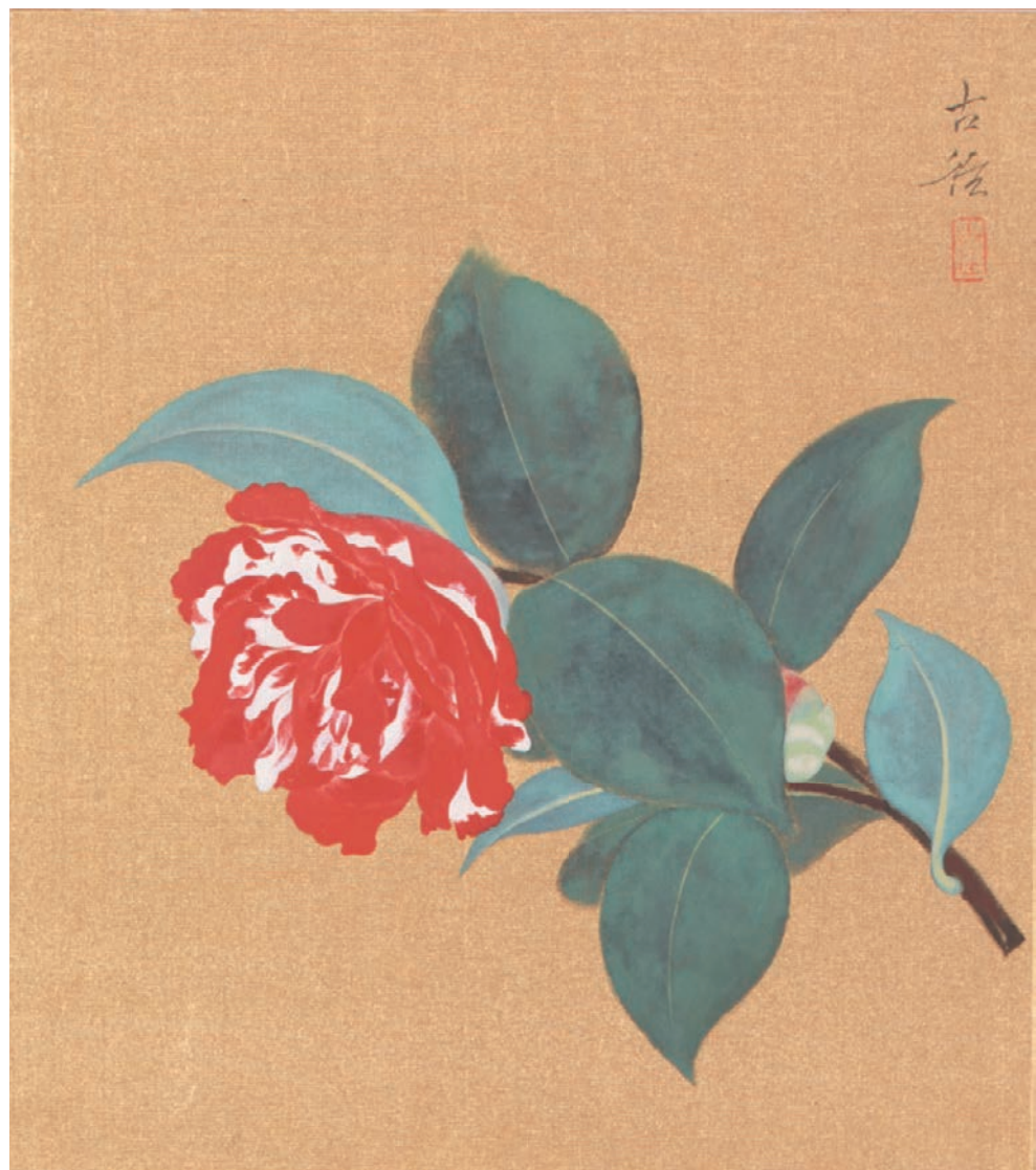
小林古径(椿)昭和初期 紙本金地彩色 小林古径記念美術館