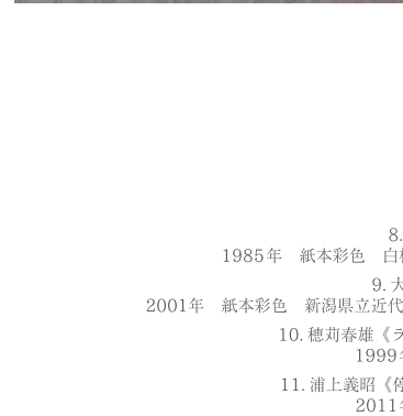
8. 長井亮之《春の朱鷺》 1985年 紙本彩色 白根カルチャーセンター 9. 大矢十四彦《明けゆく》 2001年 紙本彩色 新潟県立近代美術館・万代島美術館 10. 穂苅春雄《ランデーコタルの老人》 1999年 紙本彩色 個人蔵 11. 浦上義昭《停車場(STATION)II》 2011年 紙本彩色 個人蔵