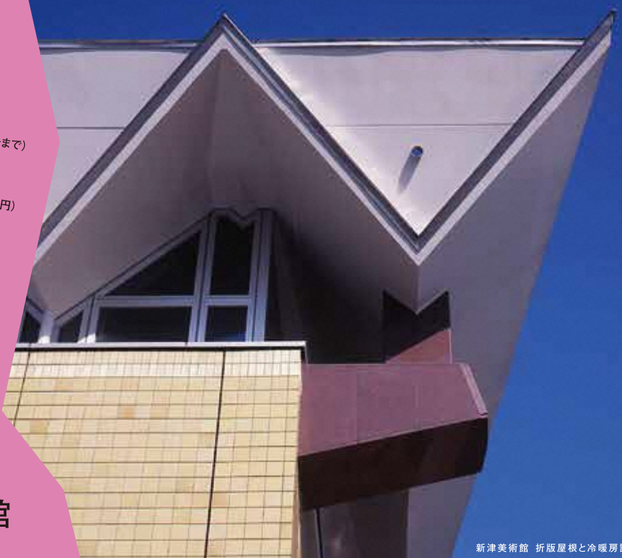
新潟美術館 折版屋根と冷暖房設備の煙突