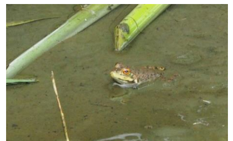
〈 ウシガエル 〉