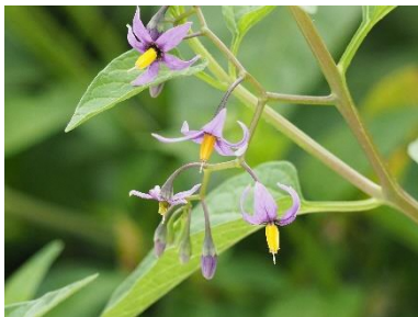
〈 オオマルバノホロシ 〉

ノゲシ、スギナ、ダイコンソウ、ヨモギ、セイヨウタンポポ、ショウブ、ツルボ、カタバミ、シロツメクサ、コウホネ、フトイ、ホタルイ、ケキツネノボタン、ニワゼキショウ、オオマルバノホロシ、ウキヤガラ、ヒシ、デンジソウ、ヒメジョオン、セリ、チチコグサ、オニタビラコ、ガマ、ウシノケグサ、ホソムギ、シラゲガヤ、ブタナ、ヤブジラミ、ホタルブクロ、ハス、ハンゲショウ、クサノオ、オオバコ、アマトラノオ、イヌゴマ、チゴザサ、ヤマアワ、ツユクサ、ミゾカクシ、アレチマツヨイグサ、オオマツヨイグサ、ミソハギ、ゲンノショウコ、ハキダメギク、ハッカ、オオフタバムグラ、ミズヒキ、サクラタデ、ヒメシロネ、シロバナサクラタデ、アメリカタカサブロウ、タケトアゼナ、キンエノコロ、カゼクサ、ヒメクグ、ノコンギク、アキノノゲシ、トキワハゼ、ヌカキビ、チカラシバ、イヌタデ、オオイヌタデ、ヒメジノ、メヒシバ、イボクサ、アメリカセンダングサ、タウコギ、クサネム、アキノウナギツカミ、セイタカアワダチソウ、キツタ、スイカズラ、キカラスウリ、ノブドウ、ヒルガオ、クズ、アオツツラフジ、ヘクソカズラ、ヤブガラシ、ヒヨドリジョウゴ、ツルマメ、ガガイモ、カナムグラ、ヤツデ、ヤブツバキ、アオキ、モッコク、トベラ、エノキ、タチヤナギ、コブシ、ソメイヨシノ、オオシマザクラ、クワ、オニグルミ、クヌギ、ウバメガシ、コマユミ、ケヤキ、コナラ、ニワトコ、アカメガシワ、タブノキ、エゴノキ、ノイバラ、ニワウルシ、ウコギ、シロダモ、ハマナス、ネムノキ、コムラサキシキブ、マユミ、ヤマウコギ、アオギリ、ムクゲ、サルスベリ、ヤマボウシ、ヌルデ