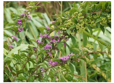
〈 コムラサキシキブ 〉