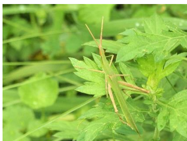
〈 ショウリョウバッタ 〉