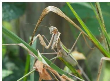
〈 チョウセンカマキリ 〉