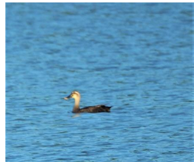
〈 カルガモ 〉