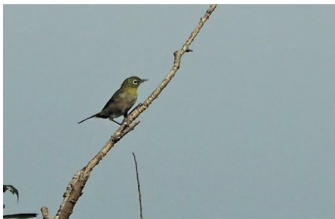
〈 メジロ 〉