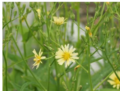
〈 アキノノゲシ 〉