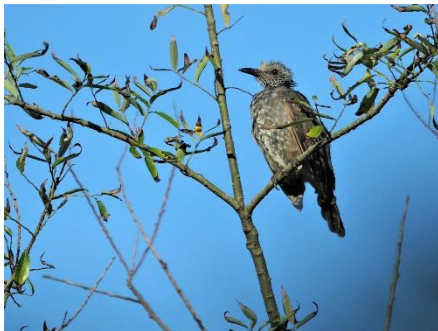
〈 ヒヨドリ 〉

キジ、マガン、ヒドリガモ、マガモ、カルガモ、オナガガモ、コガモ、ホシハジロ、キンクロハジロ、カイツブリ、ハジロカイツブリ、カンムリカイツブリ、キジバト、カワウ、ヨシゴイ、ゴイサギ、アオサギ、ダイサギ、チュウサギ、コサギ、イソシギ、コアジサシ、クロハラアジサシ、ミサゴ、トビ、チュウヒ、オオタカ、カワセミ、コゲラ、モズ、オナガ、ハシボソガラス、ハシブトガラス、シジュウカラ、ヒバリ、ツバメ、ヒヨドリ、ウグイス、エナガ、メジロ、オオヨシキリ、コヨシキリ、ムクドリ、コムクドリ、エソビタキ、コサメビタキ、スズメ、ハクセキレイ、カワラヒワ、ホオジロ、アオジ