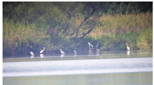
〈 佐潟の様子 〉