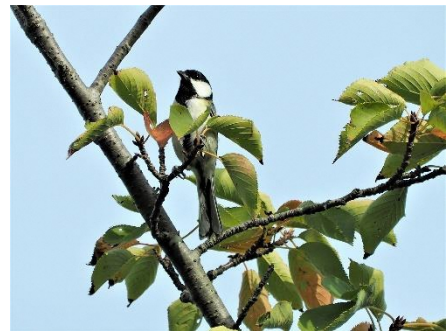
〈 シジュウカラ 〉