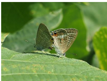
〈 ウラナミシジミ 〉

モンシロチョウ、ベニシジミ、ヤマトシジミ、ウラナミシジミ、ウラギンシジミ、ゴイシジミ、ルリシジミ、シジミチョウの仲間、ナミアゲハ、アオスジアゲハ、キアゲハ、キタキチョウ、モンキチョウ、ヒメアカタテハ、イチモンジセセリ、スカシバの仲間、トモエガ類（幼虫）、ホソオビアシブトクチバ、カキバトモエ（幼虫）、アブラゼミ、ツクツクホウシ、スズメバチの仲間、クマバチ、ミツバチの仲間、アシナガバチの仲間、キンケラハナガツチバチ、コフキトンボ、シオカラトンボ、ウチワヤンマ、セスジイトトンボ、アオモンイトトンボ、コシアキトンボ、ギンヤンマ、ウスバキトンボ、アキアカネ、ノシメトンボ、コバネイナゴ、エンマコオロギ、クルマバッタモドキ、ショウリョウバッタ、スズムシ、セスジツユムシ、アオマツムシ、オンブバッタ、ウスイロササキリ、クサキリ、ジュウシカメムシの仲間、ハラビロカマキリ、チョウセンカマキリ、コカマキリ、ゴマダラカミキリ、オオモンクロベッコウ、オヒラタシテムシ、アオハハゴロモ、ベッコウハゴロモ、ツマグロオオヨコバイ、ジョロウグモ、カタツムリの仲間、コイ、ライギョ、スジエビ、アメンボの仲間、ウシガエル、ニホンアマガエル、アズマヒキガエル、ヒガシニホントカゲ、ニホンカナヘビ、クサガメ、ミシシippアカミミガメ、スッポン、アオダイショウ、アメリカザリガニ