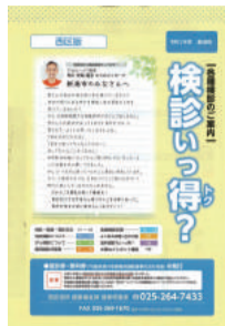
検診案内冊子(今年度の表紙は黄色です)

40歳以上の国民健康保険加入者などへ各種受診券と検診案内冊子を順次お送りしています。案内冊子には詳しい内容と料金が載っているのでご確認ください。