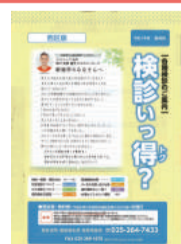
検診案内冊子(今年度の表紙は黄色です)