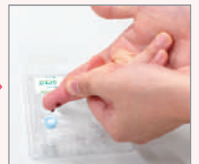
指定の容器に血液を採取します

④血液を採取した容器を、すぐに同梱の遠心分離機にかけます。その後冷蔵保存し、当日または翌日に問診票を同封して返送してください。