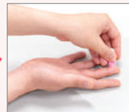
専用の器具で指の側面に針を刺します