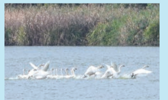
10月7日にコハクチョウが今季初飛来しました

日時 12月5日(土)午前7時～9時 定員 先着16人(小学生以下は保護者1人同伴) 申し込み 18日(水)から電話で同センター