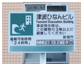
津波避難ビルの看板