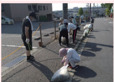
わたしたちの街をキレイに!