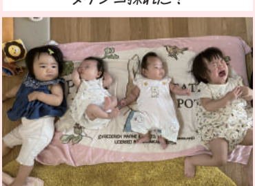
ちびっこガールズ集合