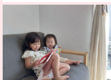
子どもたちの支え合い!