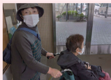
お疲れさまでした さあ、帰ろう