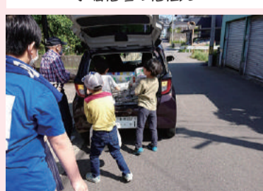
高齢者と子どもの古紙回収