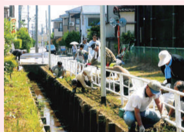
西区一斉クリーンデー