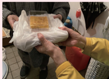
年の瀬にココロもあったか卵焼き