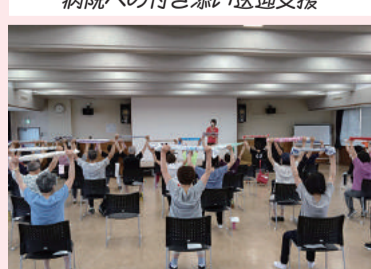
さか! 輪健康づくり教室