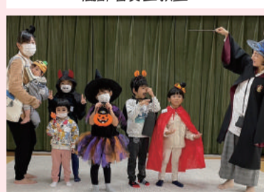
ハロウィン楽しいな!