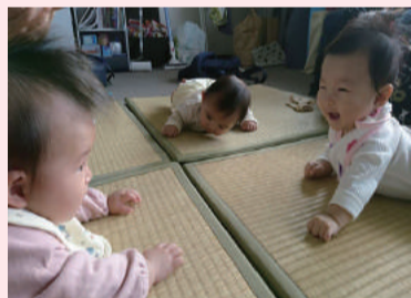
0歳 3人の井戸端会議