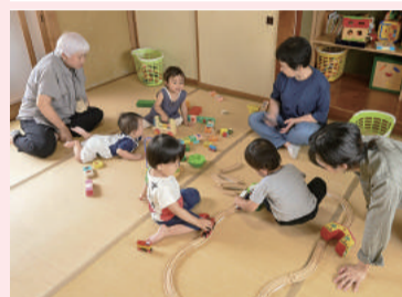
みんなでワイワイ♪