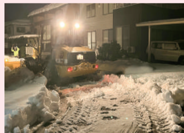
大雪の早朝自治会内除雪