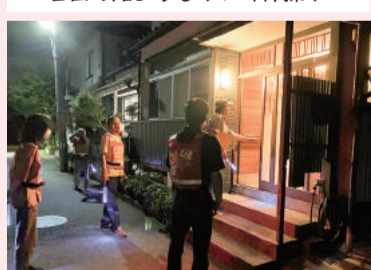
高齢者への声かけパトロール