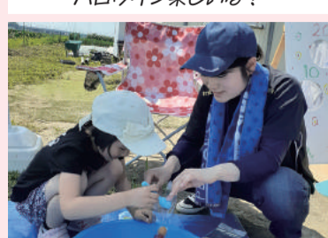
キラキラ夏野菜マルシェ