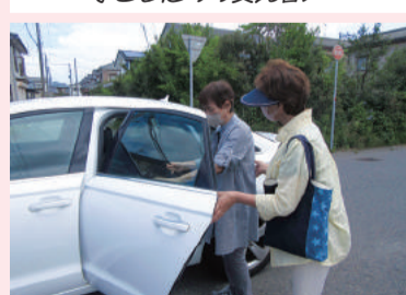
病院への付き添い送迎支援