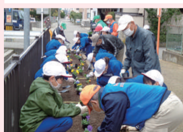
小堀花壇の花植え