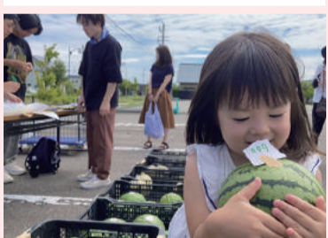
はじめてのおつかい!