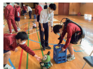
福祉ロボット体験

地域と学校が一緒になり、より良い地域をつくる活動の一環で、ウエルカム参観日を開催します。今回は、福祉分野で活躍するロボット体験です。生徒が体験する姿を、どなたでも参観できます。ぜひ、ご参観ください。