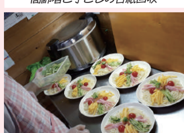
箸先に夏をとらえて