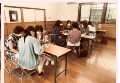
学生に教えてもらえるスマホ教室