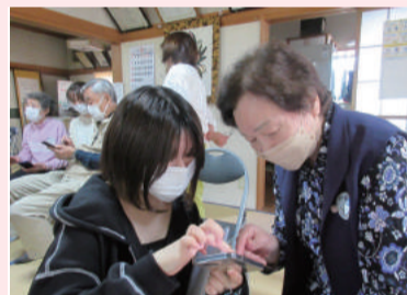
地域のお茶の間でみんな笑顔