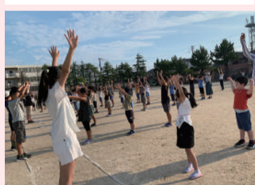
1日の始まりはラジオ体操!