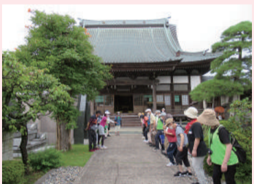
元気いきいきウォーキング