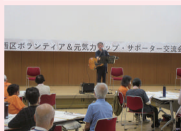
だれかを笑顔にしたい!