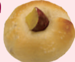
いもジェンヌベーグル