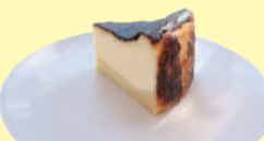
いもジェンヌ バスクチーズケーキ