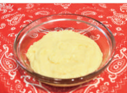
いもジェンヌのミルクジャム