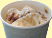
いもジェンヌブリュレラテ