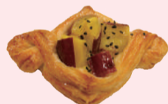
いもジェンヌデニッシュ