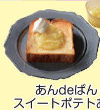
あんでいぼん スイートポテトあん