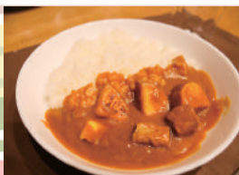
いもジェンヌカレー