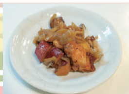
鶏肉といもジェンヌの揚げ煮