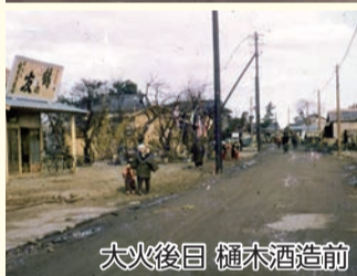
大火後日 樋木酒造前