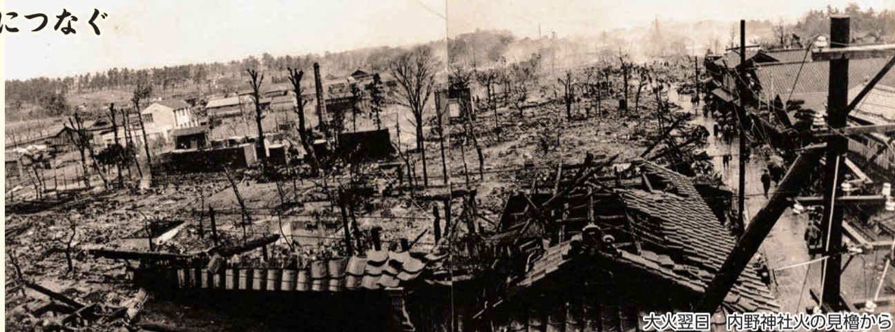
大火翌日 内野神社火の見櫓から

大火の規模として、記憶に新しい平成28年に起こった糸魚川大火が、焼損棟数147棟、焼失面積約40,000m 2 でしたので、ほぼ同規模の災害であったと分かります。