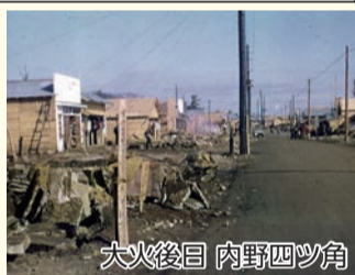
大火後日 内野四ツ角