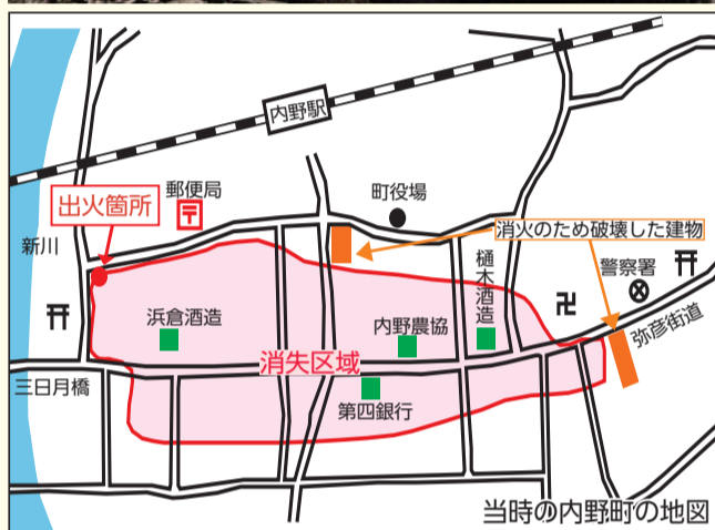
当時の内野町の地図