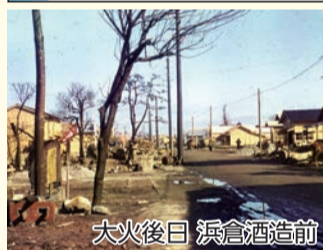
大火後日 浜倉酒造前