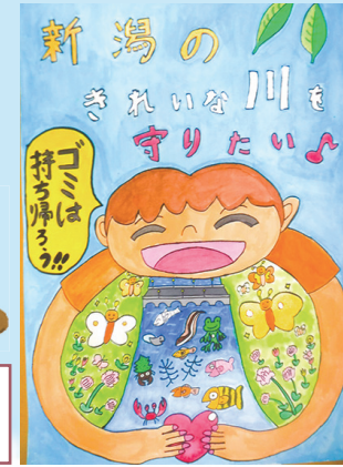
「新潟のきれいな川を守りたい」

川は生き物にとって大事な場所です。そして、きれいな場所としていつまでも守っていく必要があると思います。全ての生き物を囲んで川を守っている絵を描きました。川を守るためにゴミを持ち帰ってほしいと願っています。