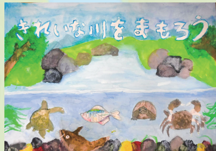
「きれいな川をまもろう」

わたしの家の水そうに、たくさんの魚やカメがいます。川でつりをしたり、あみでとった魚を水そうに入れたりして、それを見てかきました。きれいな川にはきれいな魚がすんでいるので、これからも川がきれいだといいなと思いました。