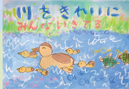
「川をきれいにするみんないきてる」

おばあちゃんのいえのちかくの川には、かものおやこや、かめがおよいでいます。いきものが生きられるよう、きれいな川をまもりつづけたいです。