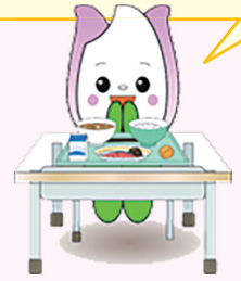
新潟市食育・花育推進キャラクター まいかちゃん

給食で使用されている新潟市産こしいぶきに代えて、月1回、区内の全小学校で西区産コシヒカリを提供中です。 11月からは新米になるよ。