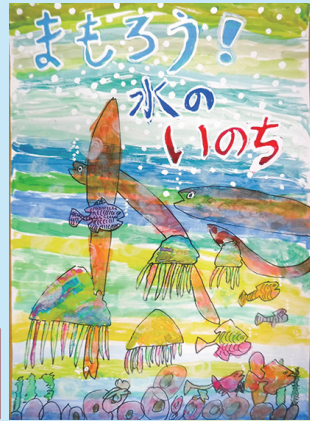
「まもろう!水のいのち」

ぼくの家の近くには、新川がながれています。1年生の夏休みに、そこで、ザリガニをつかまえたことがありました。これからも、この川をきれいにし、いろいろな生きものがすめるといいなと思い、このポスターをかきました。