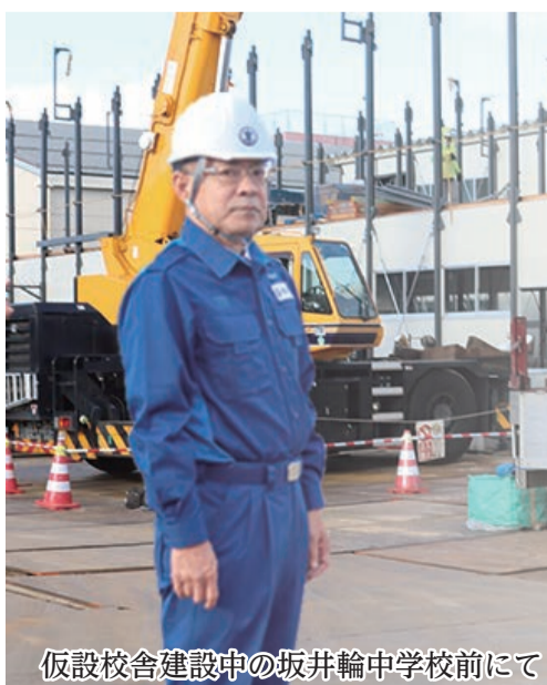
仮設校舎建設中の坂井輪中学校前にて