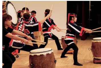
フィナーレの万代太鼓

「西区アートフェスティバル」音 楽の力、西区の宝が10月27日に開 催されました。 オープニングの力強い「豊年太 鼓」で幕が開き、学校音楽の部では、 小学生から大学生までの児童や生 徒、学生がしゅべルの高い演奏で楽し ませてくれました。公民館利用団体 の部では、各団体が日頃の練習成果 を持ち味たっぷりに発表しました。 伝統芸能の部では、雅楽、太々神楽、 万代太鼓が厳かに、かつ力強く皆さ んに感動を与えました。 子どもからお年寄りまで、来場し た6・14人が時を忘れて音楽や芸 能を堪能した一日でした。