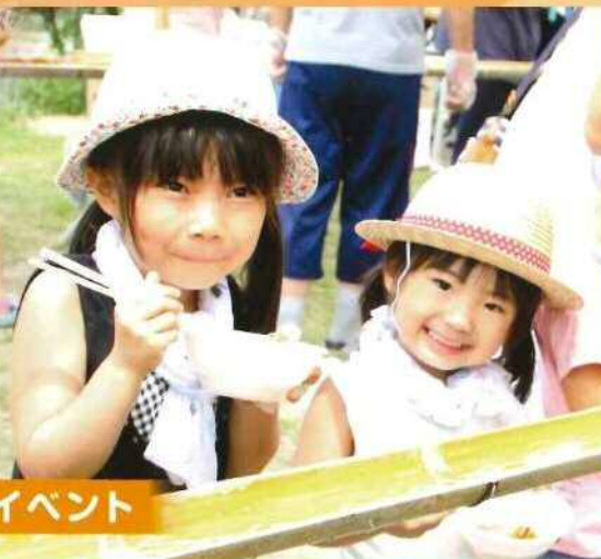
有明福祉タウン 地域交流イベント