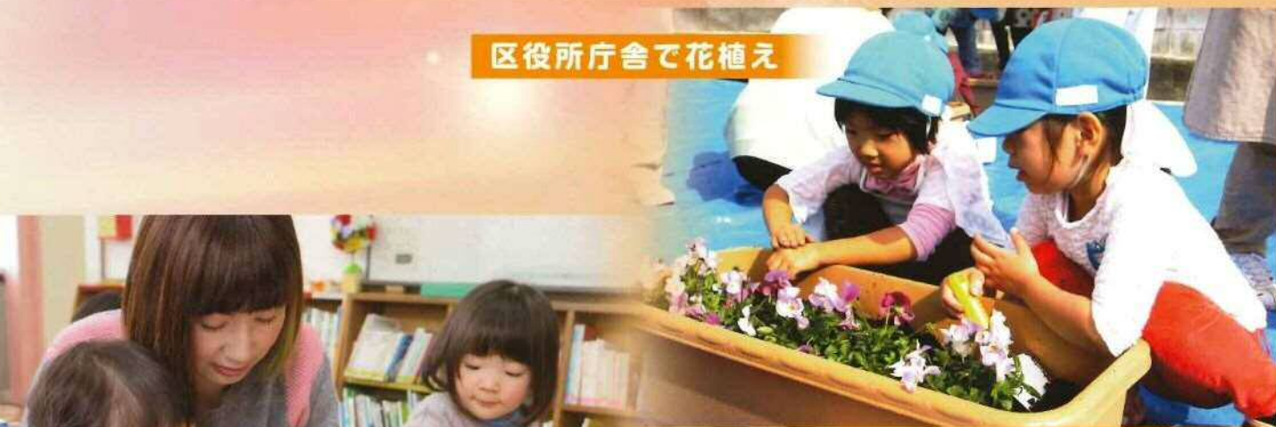
区役所庁舎で花植え