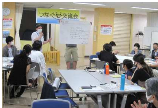
市民団体同士の交流促進を図る「つなぐ交流会」 (市民活動支援センター)