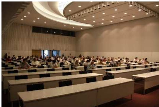
SDGs・総合計画シンポジウム(仮)