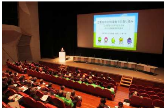
区自治協議会の全体委員研修