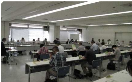
区自治協議会全体会議風景(中央区)