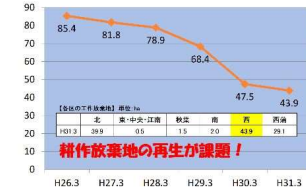
【西区の耕作放棄地の推移】