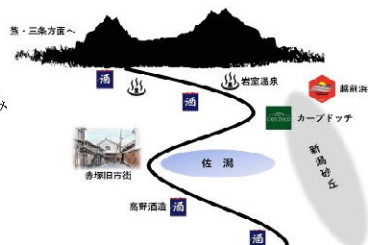
<例>弥彦・角田・未塚エリアの地域資源