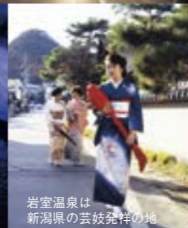
岩室温泉は新潟県の芸妓発祥の地