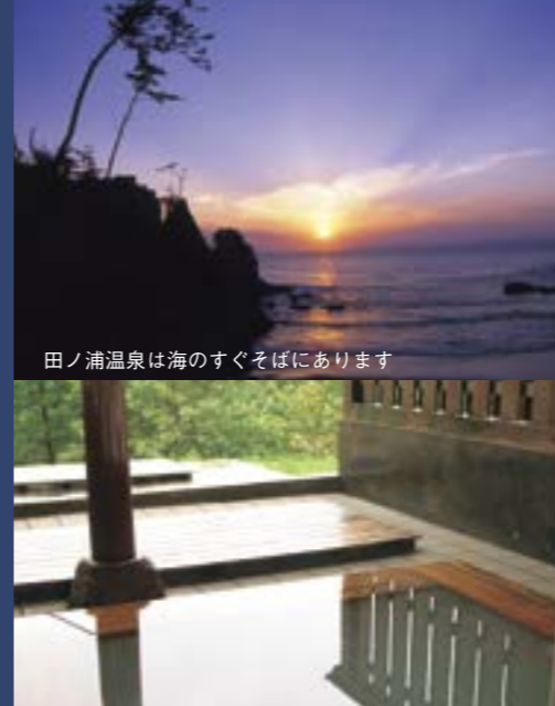
田ノ浦温泉は海のすぐそばにあります

越後七浦シーサイドライン沿い、間瀬田ノ浦海岸にある田ノ浦温泉。海の近くの温泉らしく軽い塩味がして、その分よく温まり、肌もすべすべになると評判です。各旅館の大浴場、露天風呂からは、日本海を一望できます。また、晴れた日には佐渡島、そして日本海に沈む見事な夕日を眺めることができます。海風や潮の香りを感じながらのんびりと過ごすひとときは、この地ならではの贅沢。さらに、すぐ近くの間瀬・寺泊漁港から仕入れる新鮮な海の幸を味わえるのも楽しみです。海水浴場が開かれる夏になると、賑わいも最高潮を迎えます。