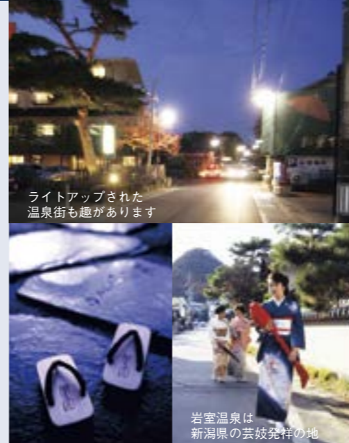
ライトアップされた温泉街も趣があります

「霊雁の湯」とも呼ばれる、歴史ある名湯・岩室温泉。その別名は、正徳3年(1713)に庄屋の高島庄右衛門が見た夢に由来しています。夢の中のお告げに従って周囲を探していたところ、一羽の傷ついた雁が湧き出ている泉流に浴して傷を癒しているのを見つけた、という伝説があるのです。江戸時代には北国街道の湯治場として、そして越後の奥座敷として栄え、親しまれてきました。温泉街には十数軒の温泉旅館が立ち並びます。料理自慢の宿が多く、山の幸・海の幸・里の幸で彩られる味わいが人々を魅了。また、岩室温泉は新潟県の芸妓発祥の地。唄・踊り・三味線などの芸で、お座敷を華やかに盛り上げます。