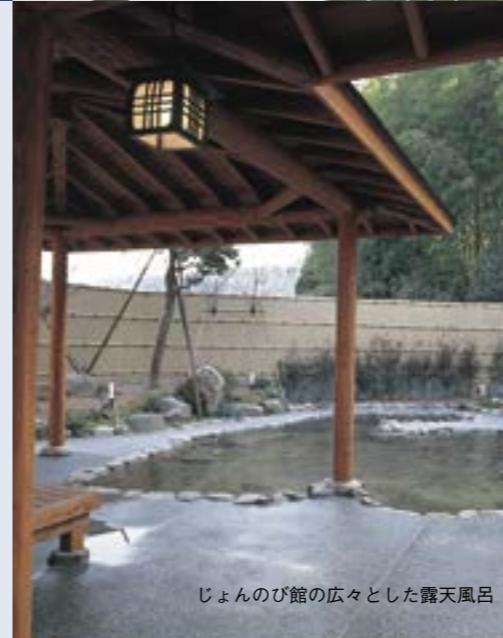
じよんのび館の広々とした露天風呂

角田山の南麓、「はたるの里公園」内に位置する福寿温泉「じよんのび館」。和風情緒ある「源氏の湯」には、杉みがき丸太を使った丸太風呂や、ホタルが飛ぶ小川をイメージした流水風呂などがあります。また、洋風の「平家の湯」には、ジャグジー、打たせ湯、寝風呂などがあります。双方の大浴場は、奇数日と偶数日で男女入れ替え。館内では食事事も楽しめます。まさに「じよんのび」気分を満喫できます。