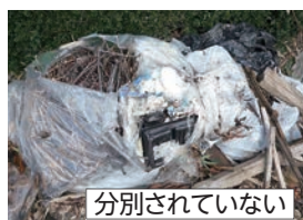
分別されていない