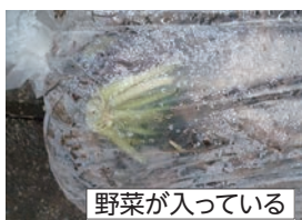
野菜が入っている