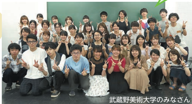
武蔵野美術大学のみなさん

広大な自然と懐かしさ漂う稲わらの香りを会場で楽しんでみませんか。少し奇妙で面白い動物たちが上堰潟公園でお待ちしています。