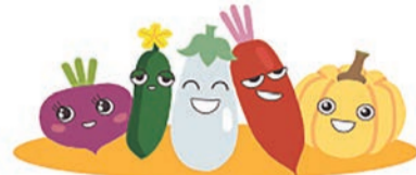
にしかなないろ野菜キャラクター