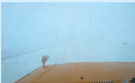
地吹雪発生時の車内からの視界

過去の状況を踏まえ、地吹雪で立ち往生した箇所や一時通行止めにした箇所には、地吹雪発生時通行注意の看板を設置しています。通行の際は注意してください。