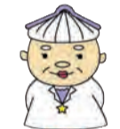
レファレンスさん

新潟市立図書館ではおすすめの本のリスト「うちどくブックリスト」を作成しています。0~2歳向けのリストもあるので、絵本選びに活用してください。