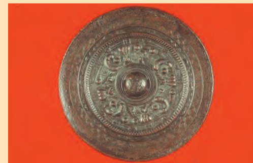
甕龍鏡(だりゅうきょう)

甕龍とは中国に伝わる霊獣のこと。このような鏡は、ヤマト王権から各地の首長へ功績や信任の証として贈られたとする説が有力です。