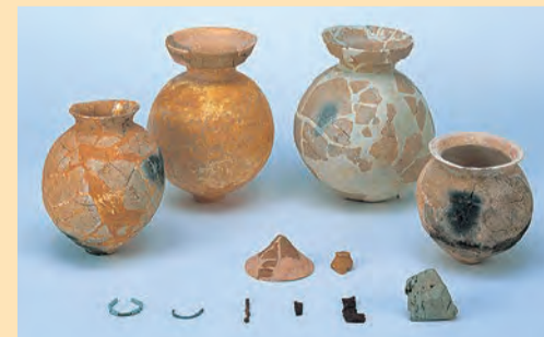
山谷古墳から出土した遺物

山谷古墳からは土器やガラス小玉などが見つかっています。こうした遺物は当時の社会をうかがい知るうえで重要な資料となっています。