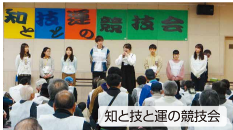
知と技と運の競技会