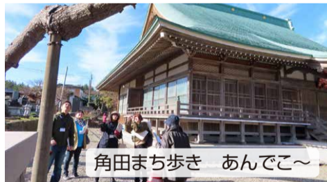
角田まち歩き あんでこ〜