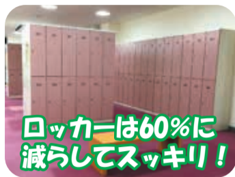
ロッカーは60%に減らしてスッキリ！