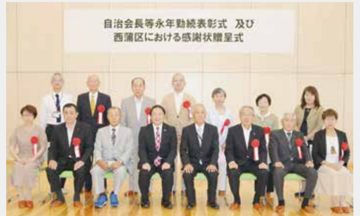
自治会長等永年勤続表彰式 及び 西蒲区における感謝状贈呈式

7月14日(火)に潟東地域コミュニティセンターにおいて、新型コロナウイルス感染拡大防止のため開催中止となった「令和元年度 西蒲区感謝の集い」にて表彰を予定していた皆さんを招き、「自治会長等永年勤続表彰式及び西蒲区における感謝状贈呈式」を行いました。受賞者は以下のとおりです。