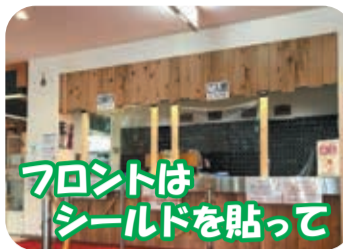
フロントはシールドを貼って