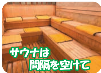
サウナは間隔を空けて