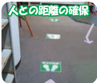
人との距離の確保

新型コロナウイルスの感染を防止するためには、一人ひとりの感染予防が極めて重要です。「人との間隔はできるだけ2m以上空ける」、「近い距離で人と会話する際はマスクを着用する」、「こまめな手洗い・手指消毒」など、新型コロナウイルスにかからない・うつさないことを強く意識しましょう。