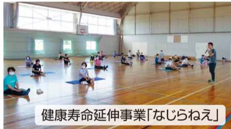
健康寿命延伸事業「なじらねえ」