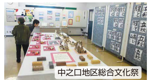
中之口地区総合文化祭