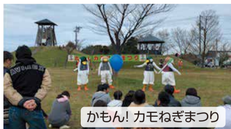
かもん! カモねぎまつり