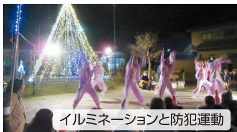
イルミネーションと防犯運動