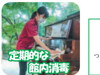
定期的な館内消毒