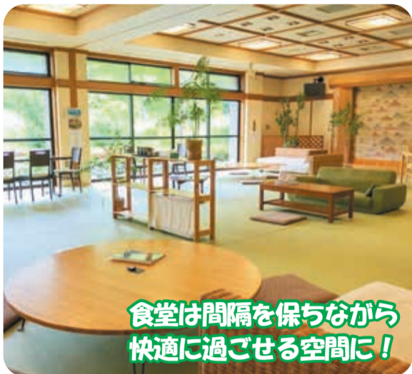
食堂は間隔を保ちながら快適に過ごせる空間に！

電話：0256-72-4126 所在地：新潟市西蒲区福井4067 ホームページ：https://www.jonnobi.com/