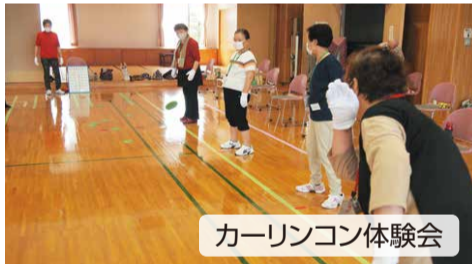
カーリンコン体験会

鯛車地域活性化事業、まちづくり・だがしや楽校、巻地区まちづくり音楽文化講座、ほか