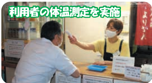
利用者の体温測定を実施