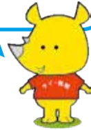
新潟市ごみ減量推進キャラクター サイチョ

西蒲区は全市と比べるとごみ量は多いけど、3年連続で減っているね!!このまま減らそうね。