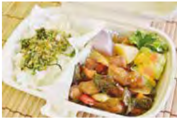
巻高なないろ弁当 <主なおかず> なないろ酢豚・緑カリフラワーのサラダなど

巻高校の生徒は、食生活と地球環境とのつながりをテーマに、食料自給率や環境への負荷などについて授業を通して学習しました。その一環で、地元西蒲区で採れた食材として、にしかん なないろ野菜を使い、調理実習を行いました。