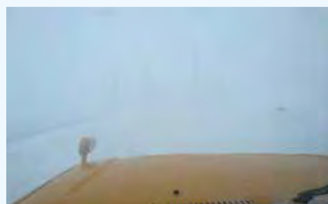
地吹雪発生時の車内からの視界

過去の状況を踏まえ、地吹雪で立ち往生した箇所や一時通行止めにした箇所には、地吹雪発生時通行注意の看板を設置しています。通行の際は注意してください。