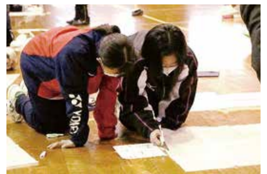
巻西中学校での地域防災共育事業の様子

だからこそ、地域で支えあうことの大切さを学ばせていただきました。これからも、区民の皆さまと力を合わせ、未来に向けたまちづくりに取り組んでまいります。 新型コロナウイルス感染症の一日も早い収束を願いながら、今年一年が区民の皆さまにとって笑顔があふれる年になりますようお祈り申し上げます。