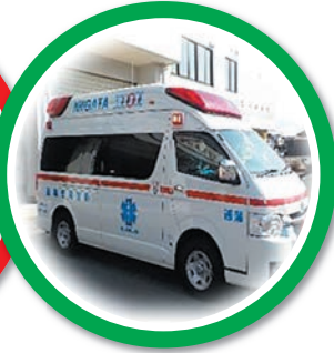
二次救命処置と集中治療