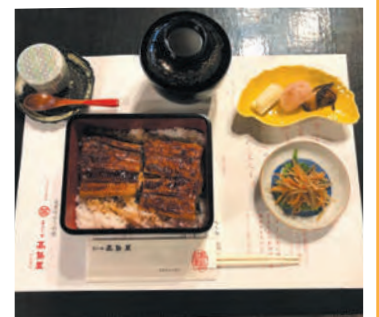
ミニパクチョイ ラディッキオ