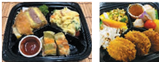
※写真は昨年度販売された総菜です

松野尾地区の「割烹えびすや」と漆山地区の「割烹魚寅」による、なないろ野菜の特性を生かした総菜を販売します(各日各30個、なくなり次第終了)。