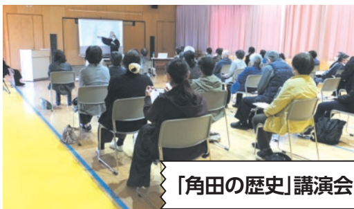
「角田の歴史」講演会

「浜の記憶」記録プロジェクト、地域福祉の充実、地域を花で飾り隊、環境保護対策など