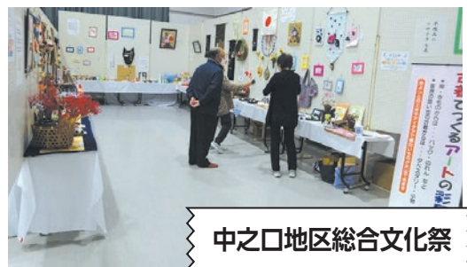
中之口地区総合文化祭

所在地 西蒲区中之口626(コミュニティセンター内) ☎ 025-201-9399