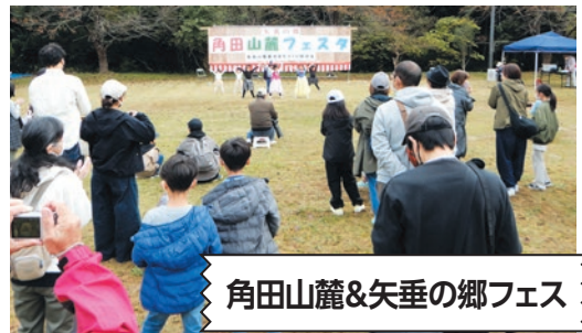
角田山麓&矢垂の郷フェス

角田山麓&矢垂の郷フェス、いきいき健康づくり、カーリンコン競技、健康づくり教室など