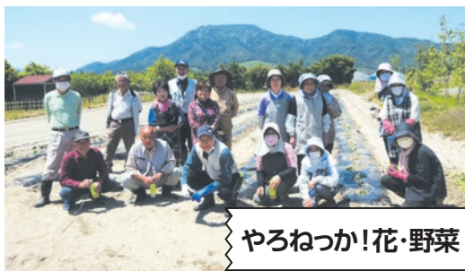
やろねっか!花・野菜

所在地 西蒲区松野尾2852-3(コミュニティセンター内) ☎ 0256-78-8893