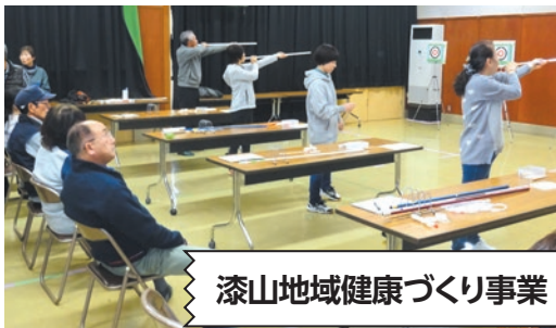
漆山地域健康づくり事業