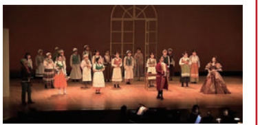
※写真は今回の内容とは異なります