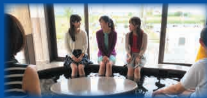
▲いわむろやの足湯