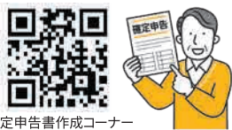
確定申告書作成コーナー

自宅のパソコンやスマートフォンで、便利な e-Tax やスマホ申告が利用できます。 マイナンバーカード読み取り対応のスマートフォン または IC カードリーダライタを用いて、国税庁ホームページ「確定申告書等作成コーナー」を利用すれば、確定申告会場に出向かなくても、e-Tax で確定申告書を提出できます。