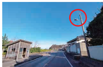
▲間瀬新村バス停前