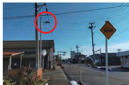
▲川崎踏切付近の交差点

老朽化した道路照明灯をLEDに取り替えたことにより周辺が明るくなり、より安全に通行できるようになりました。