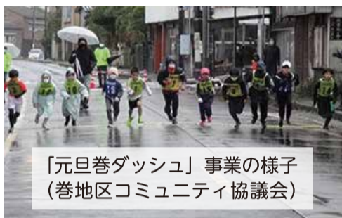
「元旦巻ダッシュ」事業の様子 (巻地区コミュニティ協議会)