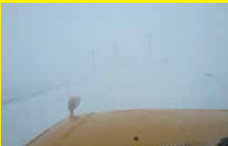
▲地吹雪発生時の車内からの視界

地吹雪が発生すると視界が悪くなり、運転が大変困難となります。地吹雪が発生する恐れのある広域農道など、周囲が開けた道路の利用はできるだけ避け、幹線道路を利用しましょう。 過去の状況を踏まえ、地吹雪で立ち往生した箇所や一時通行止めにした箇所には、地吹雪発生時通行注意の看板を設置しています。通行の際は注意してください。