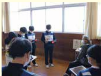
▲行方不明者役の人を発見し、声掛けしている様子

訓練では、行方不明者役の人が各班に配置され、生徒は行方不明者役の人を校舎内で捜索し、発見した際の声掛けの仕方などを学びました。生徒からは、「身近に認知症の人がいるため、とても勉強になった。学んだことを今後活かしていきたい」との感想が聞かれました。