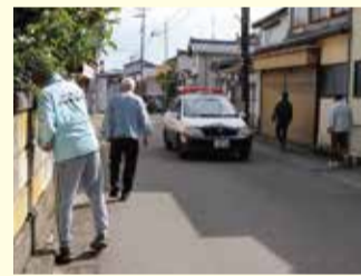
▲捜索している様子

捜索後のグループワークでは、「歩いて捜索しているなかで、地域内の危険個所の把握が必要だと感じた」「認知症の人が行方不明になったときのおおまかな流れについて理解できた」などの感想が聞かれました。