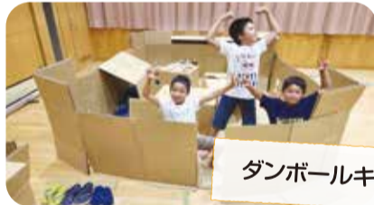
ダンボールキャンプ

事務局 角田浜 1815-1 (角田地区コミュニティセンター内) ☎0256-78-8822