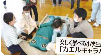
楽しく学べる小学生防災訓練 「カエルキャラバン」