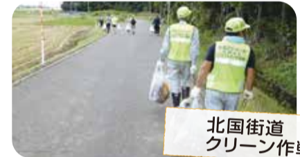
北国街道 クリーン作戦

いきいき健康づくり事業(健康体操教室)、カーリンコン競技事業、健康づくり教室など