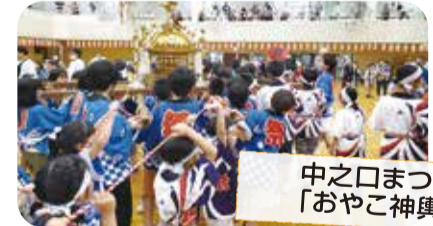
中之口まつり 「おやこ神輿」

事務局 中之口 626 (中之口地区コミュニティセンター内) ☎025-201-9399