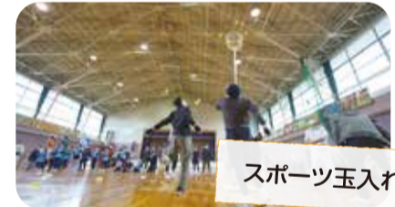
スポーツ玉入れ大会

事務局 旗屋 701-2 (西川地域コミュニティセンター内) ☎0256-88-5900