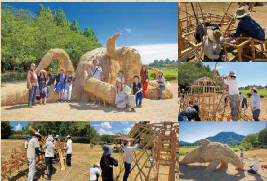
▲わらアート制作の様子 (昨年度)

今年も、東京の武蔵野美術大学などの学生が来県し、わらアート作品を制作します。一緒にわらアートを制作するサポーターを募集します。ぜひ参加してください!