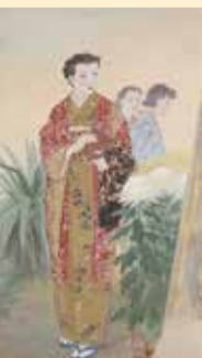
金子孝信作 「姉上の像」