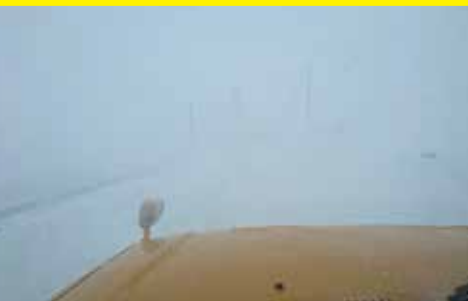
▲地吹雪発生時の車内からの視界

過去の状況を踏まえ、地吹雪で立ち往生した箇所や一時通行止めにした箇所には、地吹雪発生時通行注意の看板を設置しています。通行の際は注意してください。