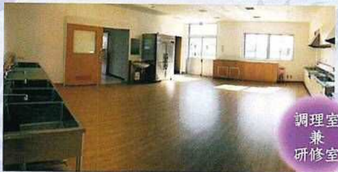
調理室 兼 研修室