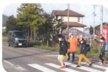
セーフティスタッフ 小学生登校時の見守り