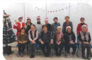
地域の茶の間「楽友会」 木曜午前10時～12時コミセンで活動