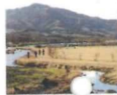
公園内の広場と水路