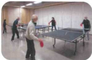
松野尾卓球クラブ 火曜午後1時～コミセンで活動

松野尾地域の世代間交流を含んだ活性化および福祉の向上に、貢献してくれることを期待します。