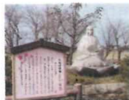
このはなさくやひの木花開耶姫