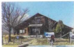
上堰滯公園休憩所