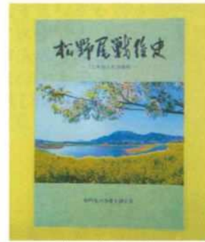
平成27年発刊 松野尾戦後史