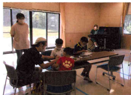
生演奏でイントロ当てクイズ